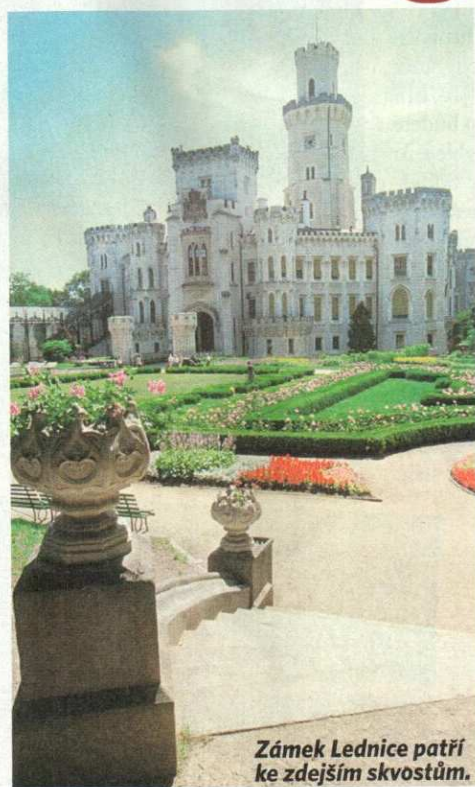
Zámek Lednice patří ke zdejšímu skvostům.